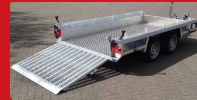
Livable en 5 modèles différents.