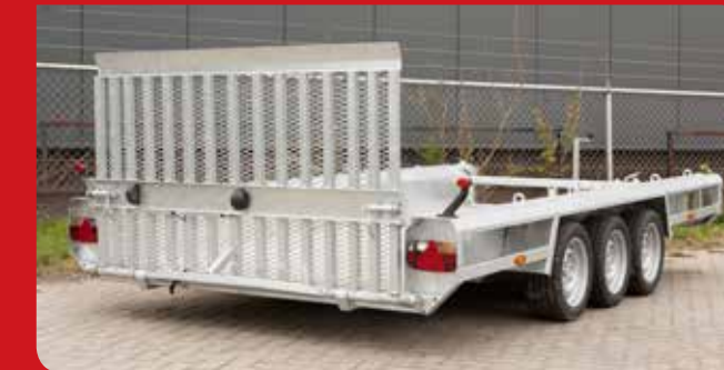
Livable avec 3 essieux (tridem).